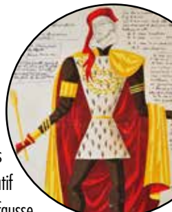
Costume de Richard II pour Gérard Philippe

Vilar élaborera aux côtés de Gischia au fil des années un répertoire de codes qui constitueront les fondements du style TNP : une mise en scène claire, vigoureuse ; le refus de tout décor trop narratif en lui préférant un minimalisme laissant la place au texte et à l'acteur , libéré de la fausse grandeur du théâtre à l'italienne ; une collaboration avec un peintre et un musicien qui réalisent des créations originales ; une lumière blanche, crue , qui rend fidèlement les couleurs chatoyantes des costumes imaginés par les peintres. Toutes ces recettes sont éprouvées pendant douze ans au cours de dizaines de pièces mises en scène par Vilar et ses régisseurs et de milliers de représentations totalisant sur la période plus de 5 millions d'entrées.