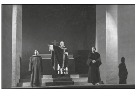
Meurtre dans la cathédrale , 1945 : 1 ère pièce mise en scène par le tandem, avec une toute nouvelle esthétique minimaliste.

Ce "compagnonnage" entre les deux hommes, comme le qualifie Vilar, fonctionne sur l'enrichissement mutuel : Gischia apporte à Vilar une ouverture vers d'autres domaines artistiques, dont celui-ci a l'intelligence de transposer les interrogations ou les réussites, et Vilar apporte au peintre, dans cet espace en trois dimensions qu'est la scène, une occasion de "voir ce qui se passe derrière sa toile". Gischia reste un "peintre au théâtre", un artiste qui cherche à résoudre des problèmes plastiques dans un espace donné.