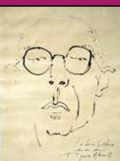
Portrait de Gischia par Edouard Pignon

La carrière de Jean Vilar (1912-1971) est connue de tous. Du Festival d'Avignon qu'il lance en 1947 à la renaissance et au succès du Théâtre National Populaire (TNP), il marque durablement le théâtre. Dans les coulisses, de toutes les aventures, se trouve Léon Gischia dont Vilar dit qu'il fut, plus que le peintre de costumes et de décors, son "conseiller capital". Par son regard distant et incisif, il l'accompagne vers ses choix les plus novateurs, et agit sur lui comme un révélateur de ses idées.